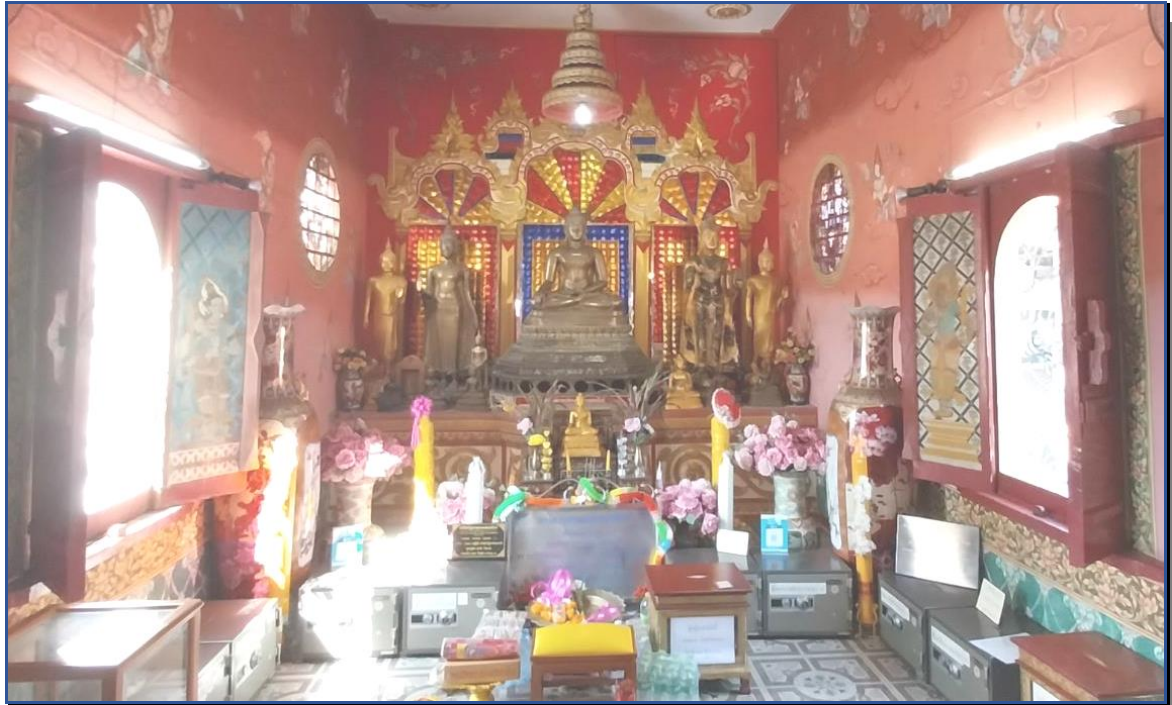
แผนยุทธศาสตร์สำนักงานพระพุทธศาสนาจังหวัดอุดรดิตถ์ (พ.ศ. ๒๕๖๗ - ๒๕๗๑)