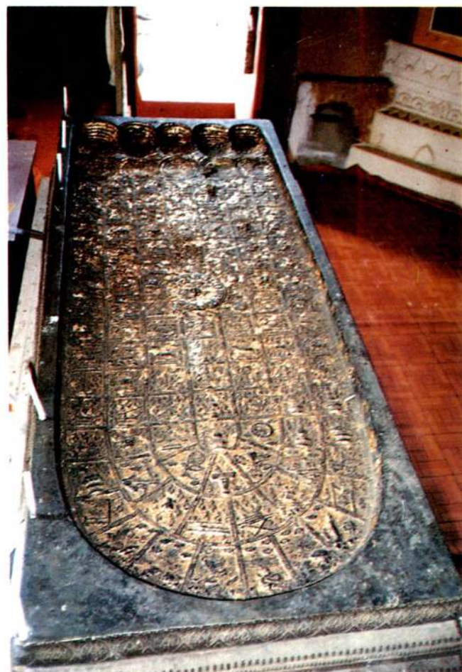
รอยพระพุทธรบาท วัดหนองไฉ้ สุโขทัย