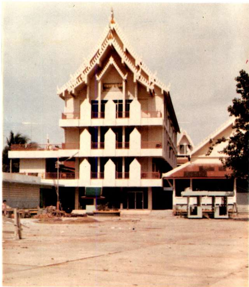
ศาลาอเนกประสงค์ วัดพระศรีรัตนมหาธาตุ พิษณุโลก