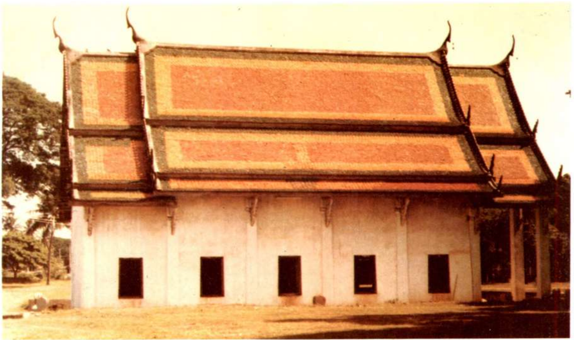
พระอุโบสถ วัดพระศรีรัตนมหาธาตุ สุโขทัย