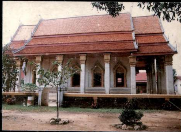
วัดคลองโพธิ์ อุดรดิตถ์