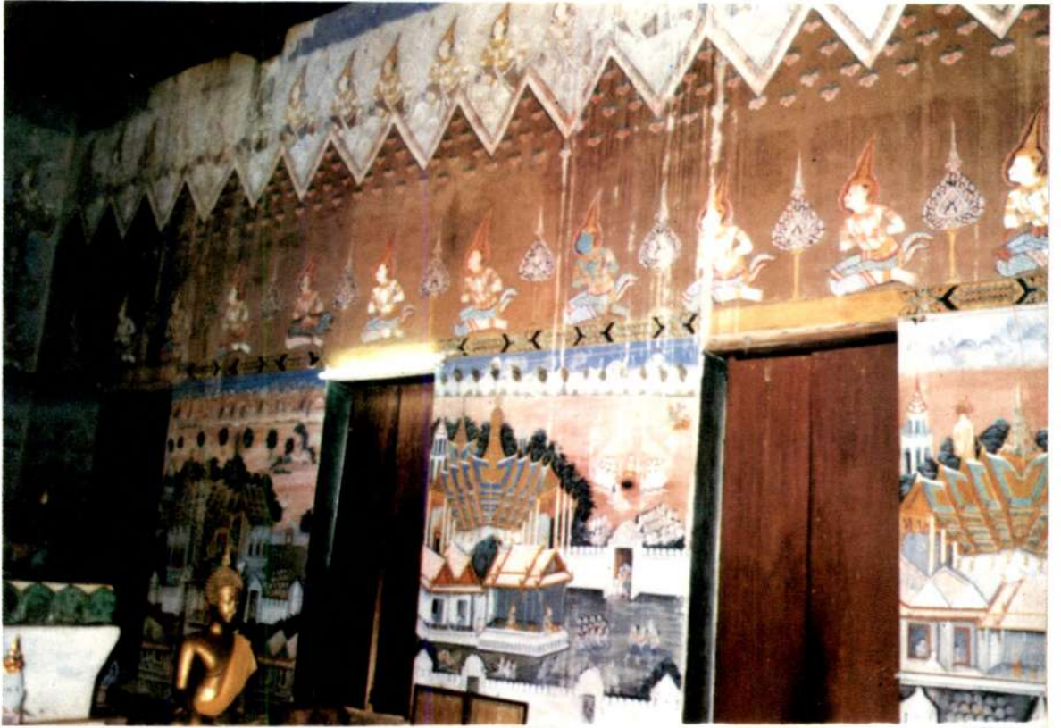
จิตรกรรมในวิหาร วัดหนองไฉ้ สุโขทัย