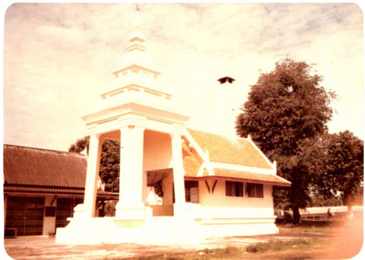
ฌาปนสถาน วัดสว่างอารมณ์ สุโขทัย