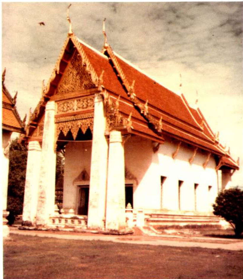
พระอุโบสถ วัดสว่างอารมณ์ สุโขทัย