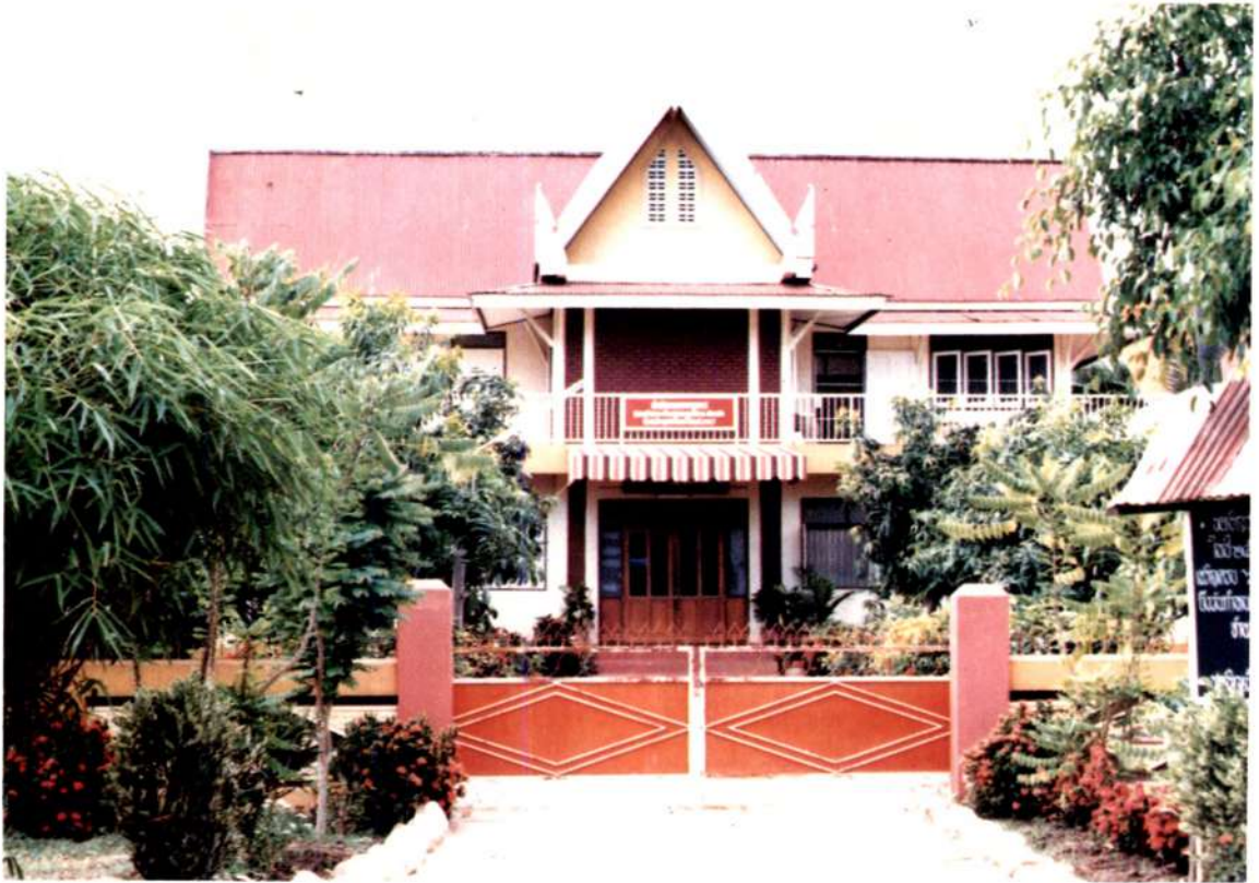
กุฏิรับรองสงฆ์ วัดคลองโพธิ์ อุดรดิตถ์