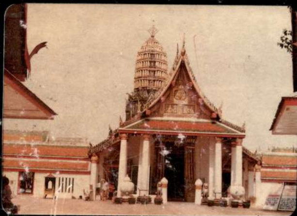
วัดพระศรีรัตนมหาธาตุ พิษณุโลก