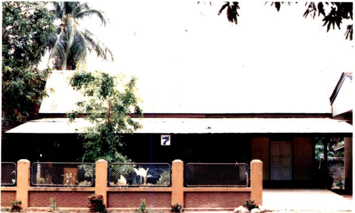
ห้องสมุด วัดคลองโพธิ์ อุดรดิตถ์