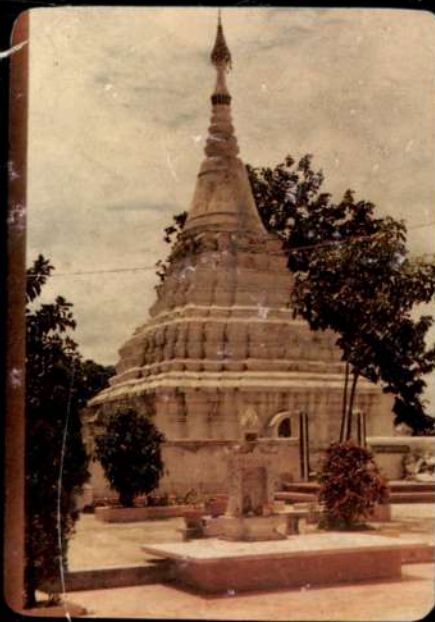
วัดมณีบรรพต ตาก