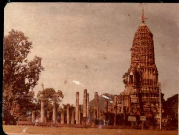
วัดพระศรีรัตนมหาธาตุ สุโขทัย