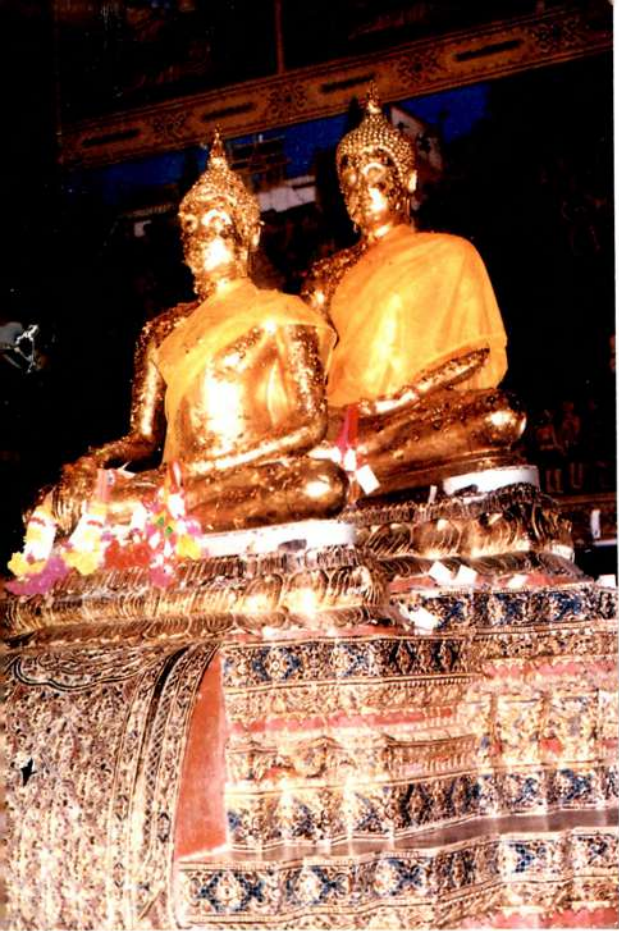
• หลวงพ่อสองพี่น้อง วัดหนองไฉ้ สุโขทัย