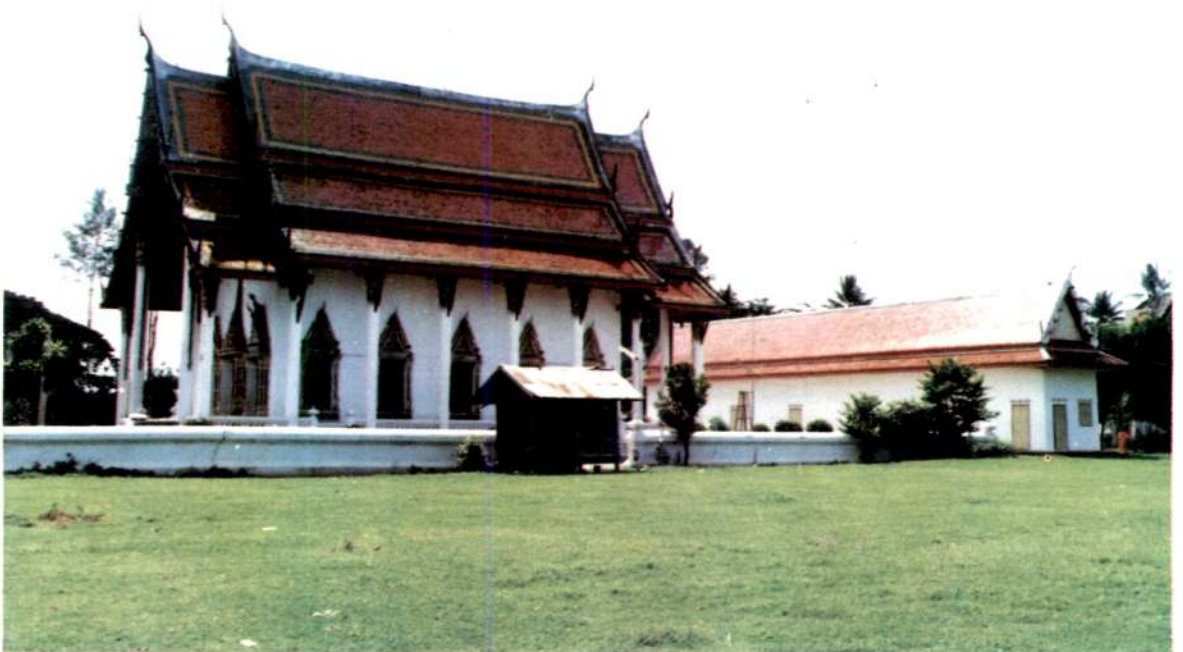
วิหารวัดหนองไฉ้ สุโขทัย