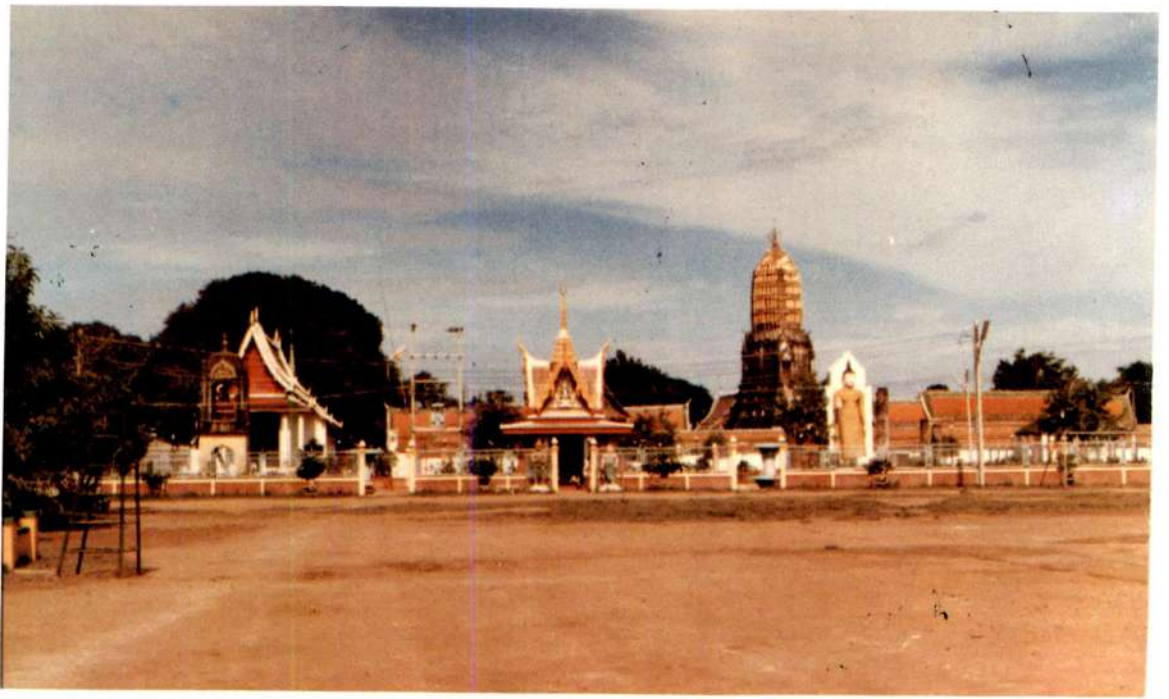
ทิวทัศน์ วัดพระศรีรัตนมหาธาตุ พิษณุโลก